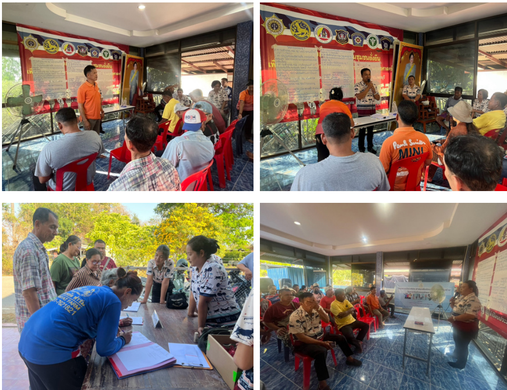
เมื่อวันที่ 6 มีนาคม 2568 องค์การบริหารส่วนตำบลนาพันสาม ได้ดำเนิน “โครงการประชามหมู่บ้านและประชามตำบลเพื่อวางแผนพัฒนาท้องถิ่นของ องค์การบริหารส่วนตำบลนาพันสาม” หมู่ที่ 9 บ้านดอนแดง