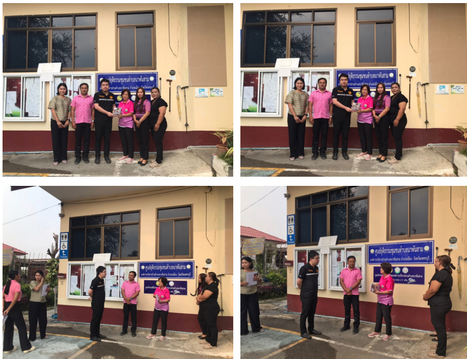
เมื่อวันที่ 4 กุมภาพันธ์ 2568 สำนักงานยุติธรรมจังหวัดเพชรบุรี ได้ลงพื้นที่โครงการนิเทศติดตามและประเมินผลการปฏิบัติงานศูนย์ยุติธรรมชุมชนประจำปับประมาณ พ.ศ.2568 โดยมีเป้าหมาย เพื่อตรวจเยี่ยมแลกเปลี่ยนปัญหาการดำเนินงาน ทั้งมอบสื่อประชาสัมพันธ์ที่เกี่ยวข้อง เพื่อใช้สำหรับปฏิบัติงานตามกรอบภารกิจการดำเนินงานของศูนย์ยุติธรรมชุมชน