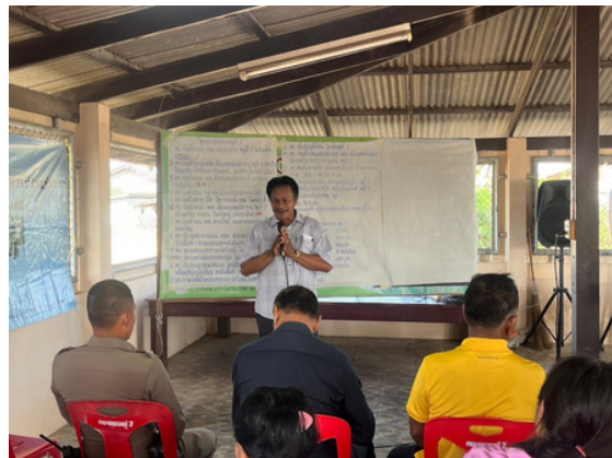
เมื่อวันที่ 4 มีนาคม 2568 องค์การบริหารส่วนตำบลนาพันสาม ได้ดำเนิน “โครงการประชุมหมู่บ้านและประชาคมตำบลเพื่อวางแผนพัฒนาท้องถิ่นของ องค์การบริหารส่วนตำบลนาพันสาม” หมู่ที่ 7 บ้านคลองใหญ่ - ฝั่งท่า