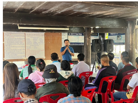
เมื่อวันที่ 5 มีนาคม 2568 องค์การบริหารส่วนตำบลนาพันสาม ได้ดำเนิน “โครงการประชุมหมู่บ้านและประชาคมตำบลเพื่อวางแผนพัฒนาท้องถิ่นขององค์การบริหารส่วนตำบลนาพันสาม” หมู่ที่ 8 บ้านนาพรหม - ดอนหัวหวด