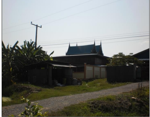
บ้านทรงไทยของ นายไพโรจน์ ทิพย์จันทร์ บ้านเลขที่ ๖๕ หมู่ที่ ๔ ตำบลนาพันสาม อำเภอเมือง จังหวัดเพชรบุรี