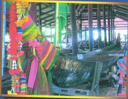
Mae Keang Thong Vessel