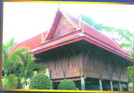
Sermon hall in a monastery